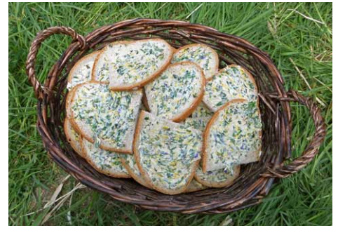
Korb mit selbstgemachten Kräuterbutterbroten