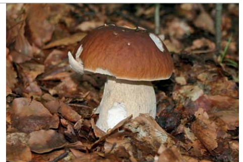
Steinpilze sind essbar und lecker