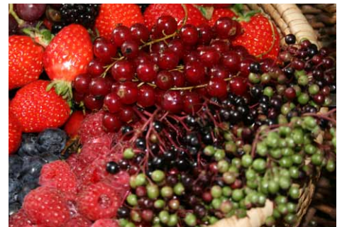
Der Wald bietet viele verschiedene essbare Früchte