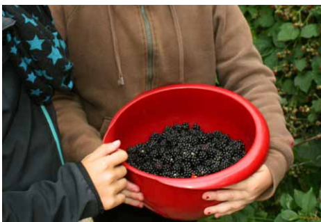
Wilde Früchtchen sammeln für den Quark