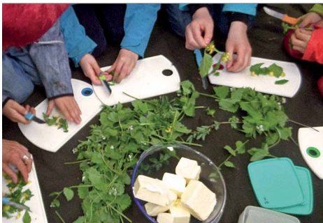
Eine leckere Kräuterbutter ist zusammen schnell gemacht